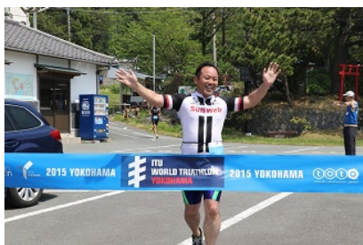
ミニレース・フィニッシュ風景