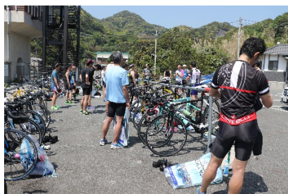
ミニレース・トランジション風景