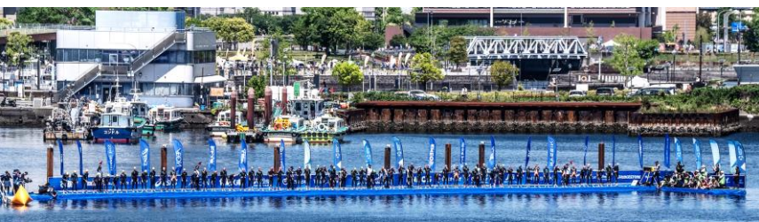
※大会で使われるポンツーン(2024大会の様子)