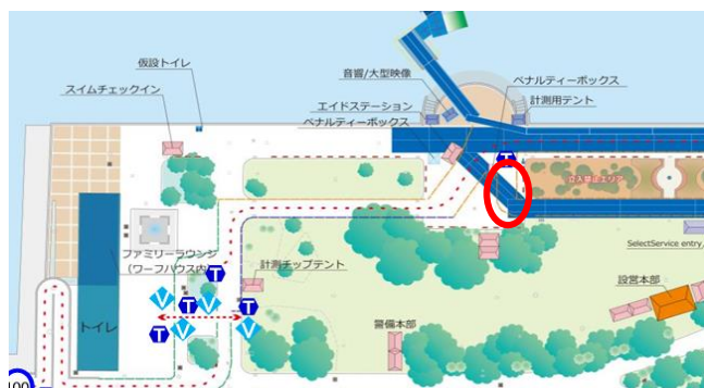
ペナルティーボックス位置