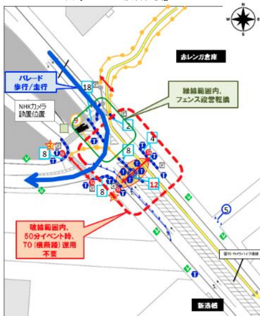
図『フェンス設営転換』