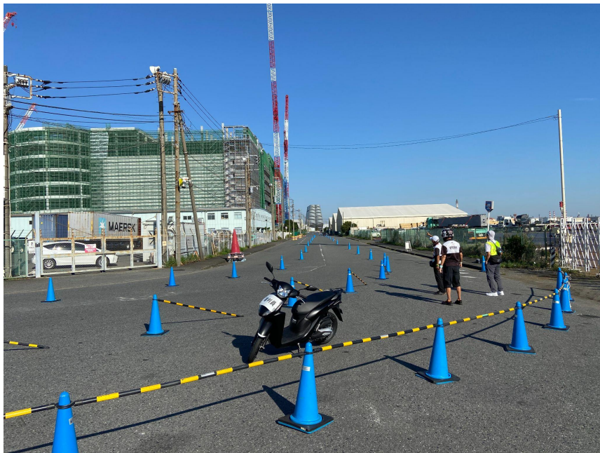
【3車線イメージ(東側直角コーナーから乗車側の光景)】