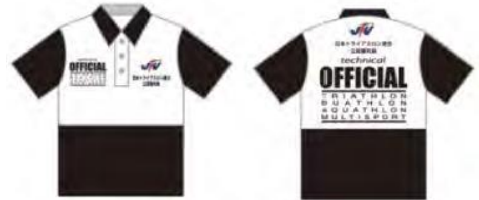
テクニカル・オフィシャル（審判員） ユニフォーム