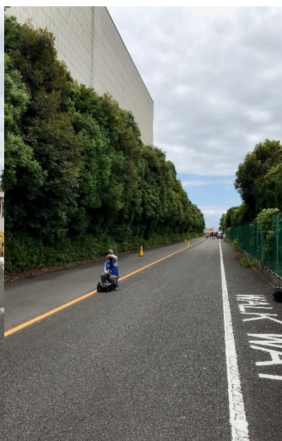
P3(直線コース間引く)